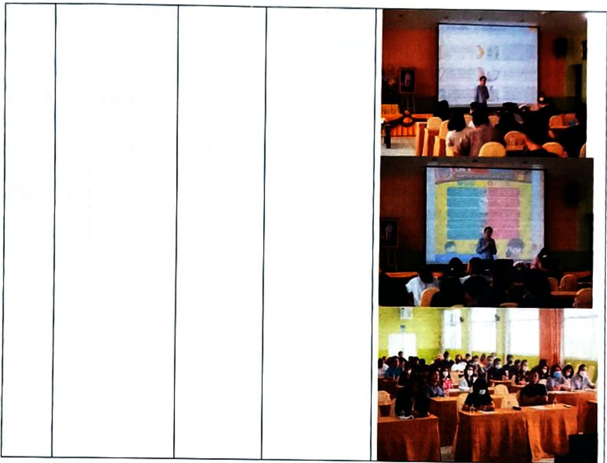
๓. รายงานการรับของขวัญและของกำนัลตามนโยบาย No Gift Policy จากการปฏิบัติหน้าที่